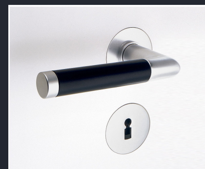
BK.4 – nur Alu natur/schwarz