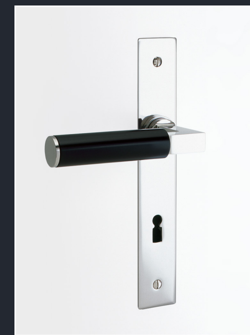
Beispiel: BK.6 Langschild

Ausführung als Langschild ist für alle Drückermodelle möglich (außer BK.4)!