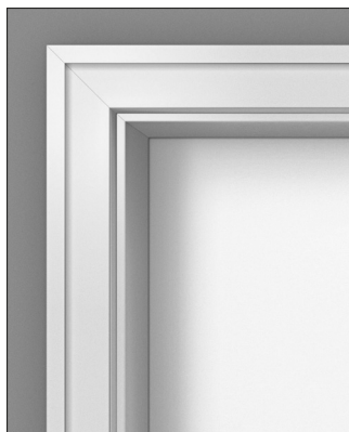
Zarge N Bekleidungsbreite: 70 mm