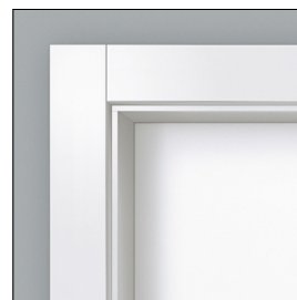
Zarge duo 90