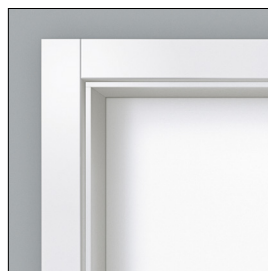
Zarge duo 70