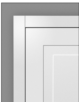
OT6. – das Profil (60 mm)