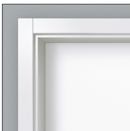
Zarge duo 55