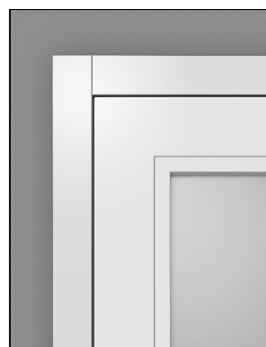
Glasleiste OT6. L und OT4. L (25 mm)