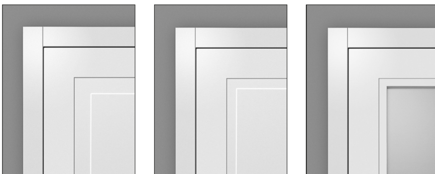
OT6. – das Profil (60 mm) OT4. – das Profil (40 mm) Glasleiste OT6. L und OT4. L (25 mm)